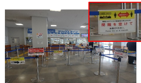
ターミナル等の衛生対策