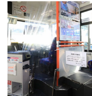
バス運転席仕切りカーテン