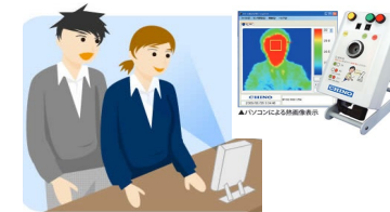
熱感知カメラ設置による感染者の公共交通利用自粛励行