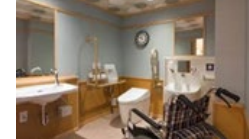
客室トイレのバリアフリー化