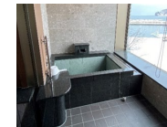
個室浴室のバリアフリー化