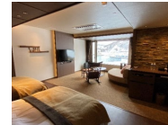
バリアフリー客室の整備