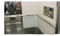
エレベーターの設置