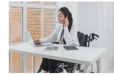
バリアフリーワークション スペースの整備