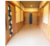
館内通路の段差解消