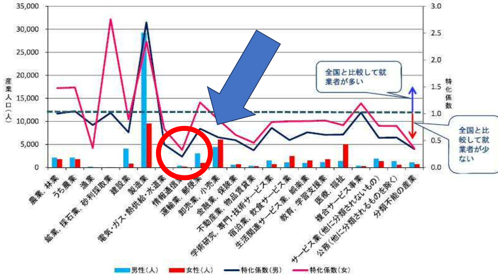
図表 17 男女別産業人口