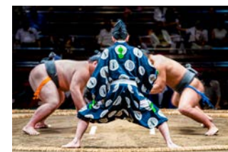
相撲部屋泊（東京都）