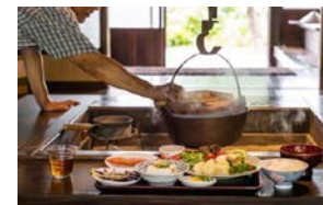
郷土料理泊（岩手県）